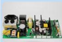
各种面板 按键 显示屏 触摸屏